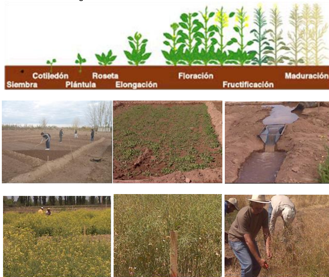
Figura 1: Estados fisiológicos

La siembra se realizó en mayo, sobre suelo húmedo, fertilizado y libre de malezas, al voleo en forma manual a razón de 6 kg de semilla por hectárea. Es importante destacar que en esta experiencia contamos con estudiantes de la carrera de agronomía, que colaboraron en las diferentes tareas que demanda el cultivo. En el estudio se analizaron 4 tratamientos (incluyendo el testigo) con 4 repeticiones cada uno. Se realizó un diseño experimental en bloques al azar y con repeticiones al azar, por lo que se dispuso de 4 bloques que contienen cada uno de ellos 4 parcelas distribuidas al azar (sorteo); siendo 16 parcelas en total con una superficie de 50 m 2 cada una (10 m x 5 m).