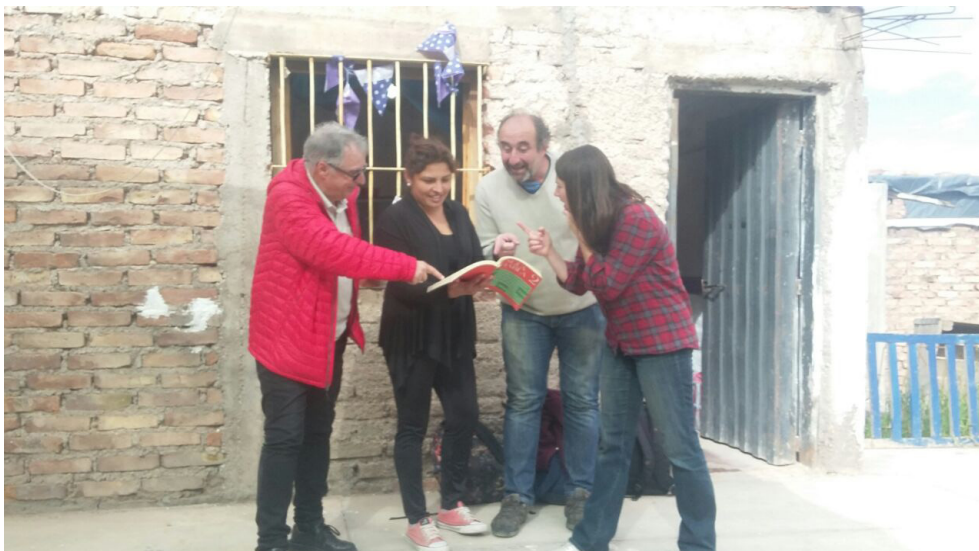
Bachillerato Popular Violeta Parra en el Barrio La Favorita