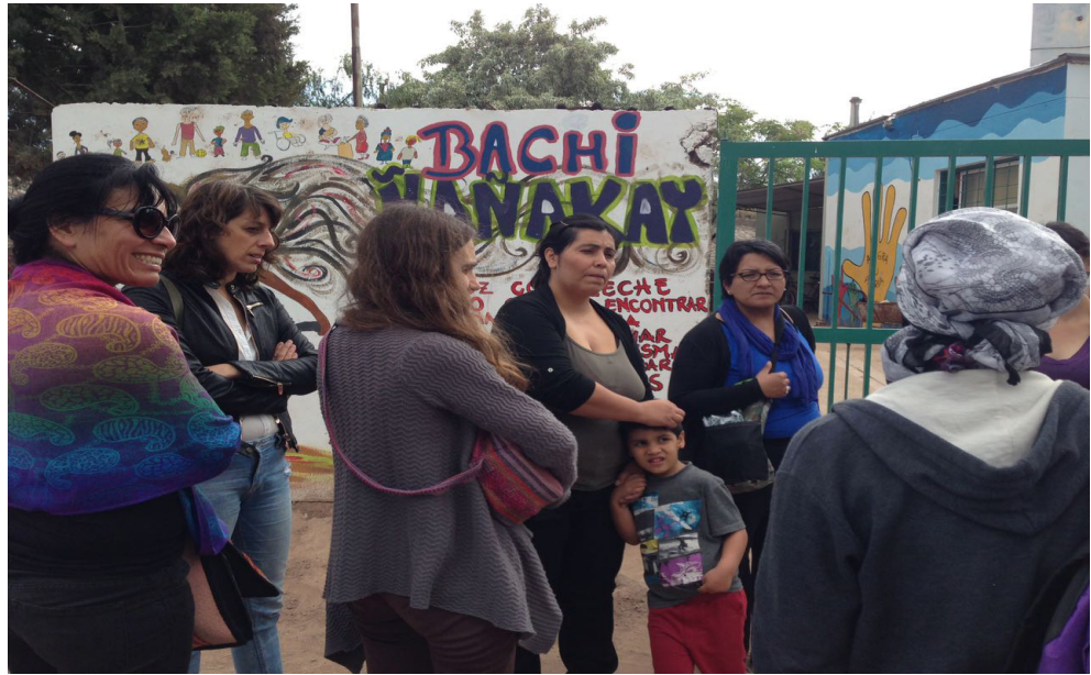
Bachillerato Popular Ñañakay en Godoy Cruz