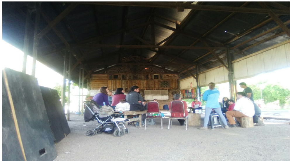
La Lagunita en Guaymallén