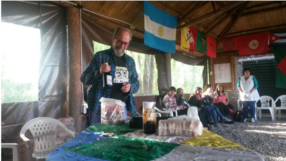
Escuela Campesina de Agroecología en Lavalle