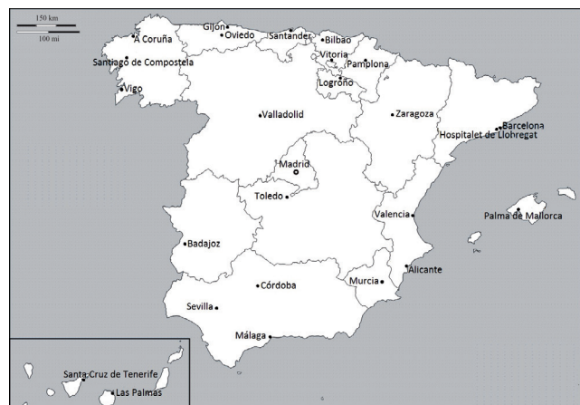
Figura 2. Localización de las ciudades españolas objeto de estudio.