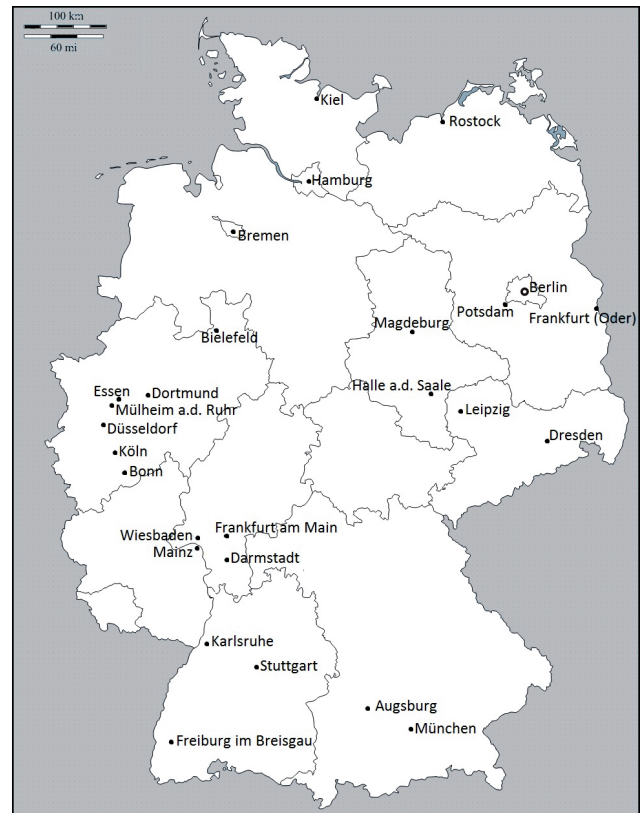
Figura 1. Localización de las ciudades alemanas objeto de estudio.

Las urbes de estos dos países ocupan posiciones muy diferentes según dos de los principales rankings de calidad de vida urbana, los elaborados por The Economist Intelligence Unit y la prestigiosa firma consultora Mercer (Mercer, 2012). En este sentido, las dos clasificaciones coinciden en situar a las ciudades alemanas en las primeras posiciones en cuanto a la calidad de vida que ofrecen, mientras que las ciudades españolas, suelen ocupar posiciones más discretas. Por tanto, partiendo del planteamiento teórico presentado inicialmente, para la construcción del índice sintético de calidad de vida urbana para las ciudades alemanas y españolas se utilizarán los siguientes indicadores parciales (Cuadro 1).