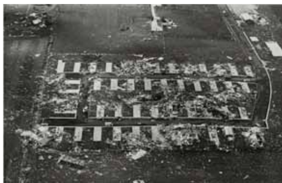
Gordon Matta Clark. SMP051103-5/11/73, Willard, Ohio.

El lugar como algo que depende del tiempo y del movimiento, en contraposición a su enraizamiento clásico con el terreno. Con esta segunda definición, y con un aumento de escala en su aplicación, la discusión sobre la generación de ciudad no tiene ningún sentido. El concepto de ciudad al que muchos se refieren actualmente está ligado íntimamente a la generación física de estructura urbana, olvidando que el carácter metropolitano de la arquitectura no debe proponerse como bálsamo para solucionar problemas meramente de alojamiento, sino como inductor para provocar acontecimientos públicos o sociales, lugares en el sentido de Yi-Fu Tuan.