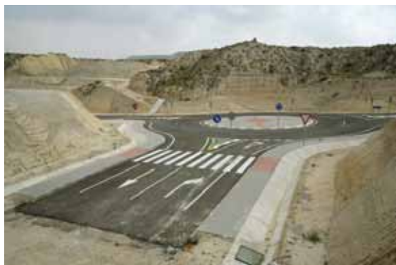
Urbanizaciones sin edificios.

No debe sorprender que lo único que trascendiese de esta situación fuese un envenenado mensaje en positivo, España es capaz de crear y construir viviendas en una proporción superior a la de Francia, Alemania y Reino Unido juntos. Algo así, visto por el resto del planeta, es un factor a considerar si vemos los graves problemas de alojamiento que tienen la mayoría de los países en los que estas teorías solían calar con gran éxito en determinados sectores (por afinidad en Iberoamérica era muy conocida esta cara de la moneda y no tanto el desastre que dicho proceso inmobiliario, de crecimiento de ciudad como magma urbano vomitado y derramado sobre nuestro territorio, se producía incontroladamente al ser generado por los fuegos de artificio del gran volcán monetario en el que se había convertido el crédito fácil).