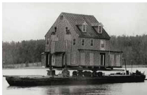
Gordon Matta Clark. Benedict, Maryland, 1972.

La necesidad de reintroducir en la normativa, en los planeamientos urbanos y en las ordenanzas, la idea de lugar, de paisaje, desde una visión ontológica-queer y no sólo geométrica, parece cada vez más una necesidad. Más cualificación frente a un exceso de cuantificación, más identidad frente al mar de la vacuidad, más “polis” en las “urbes”, más ciudadanos frente a un sobre-musculado desarrollo de estructuras e infraestructuras, más cuerpos relacionándose socialmente. Si lo queer supone no tener miedo a lo que hoy nos parece raro, podremos afrontar soluciones sin miedo a que nuestras estructuras actuales tiemblen y se reconfiguren. Al igual que Cicerón con la conocida historia de Simónides, (publicada en Metalocus, 020. Madrid, 2007. p. 66-67) quienes quiera generar ciudad queer, ciudad heterogénea, ciudad con memoria, deben producir lugares específicos, ontológicos, queer, para poder crear imágenes mentales de los hechos que acontezcan y de manera que sea posible recordarlos, para después almacenarlos en lugares, en espacios de la memoria.