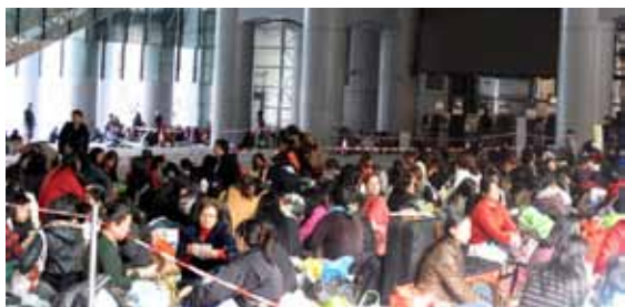
Exposición "Female, open space invaders", Video: "Ellas, Filipinas", por Marisa González.

Sus acciones en busca de identidad reflejan los mecanismos de apropiación y ocupación del territorio y el contraste entre el paisaje financiero y el uso colectivo y popular, a la vez que realizan una descodificación del monumento, con la transposición de sus usos y las diversas tipologías de colonización del mismo, desarrollando nuevos habitáculos como unidades domésticas exteriores.