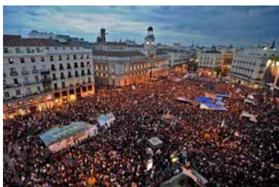
Manifestaciones del Movimiento 15-M en Puerta del Sol, Madrid, Setiembre, 2011.

La sobre-utilización de algunas palabras, como por ejemplo “lugar”, a veces les hace perder significado, las acerca a la vacuidad y se hace necesario volver a leer su definición, que a veces no es tan antigua como nos pudiese parecer, todo lo contrario, es mucho más cercana y precisa si miramos otros campos de la ciencia. Realizaré un acercamiento al concepto de “lugar” a través de las definiciones de los geógrafos.