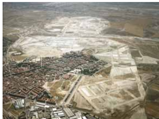
Extensión urbana de Vallecas, Madrid, en 2011. Conocido como PAU (Proyecto de Actuación Urbana) de Vallecas, ha sido el desarrollo urbanístico que más ha evolucionado (80%); el resto no ha comenzado o se encuentra en un 10 o 20% de su ejecución.

El lugar así considerado es más que un punto, un nombre o una localización: tiene significación, tiene una identidad. Por tanto, el lugar nos aparece como el producto de una relación social; un espacio se hace lugar cuando en él o con él se mantienen vínculos entre los individuos. La segunda de las imágenes de Gordon Matta-Clark, en la que se ve una típica casa americana transportada por el río en una balsa, refleja magistralmente esta definición. El vínculo que un individuo puede establecer con su morada, y por ende su capacidad para considerarla como casa, normalmente no depende de la ubicación o implantación en el territorio, sino de la relación que quien la habita establece con la misma, la capacidad que su habitante tiene para dotarla de identidad.