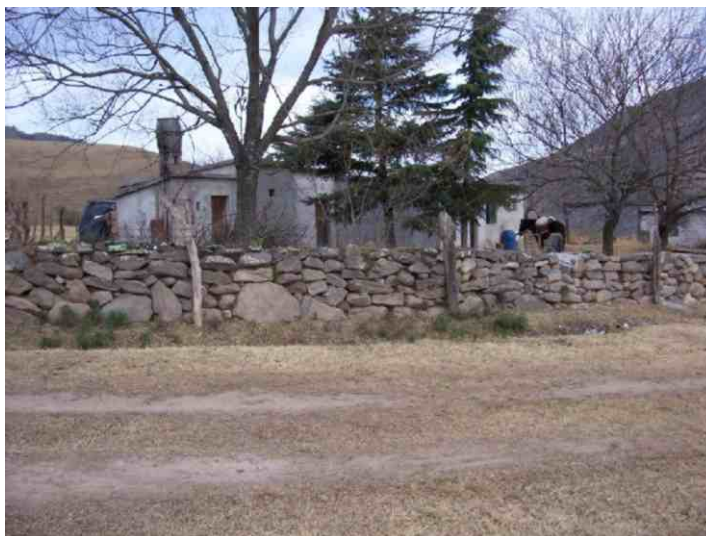
Fig. Nº 7. Vivienda típica de La Angostura