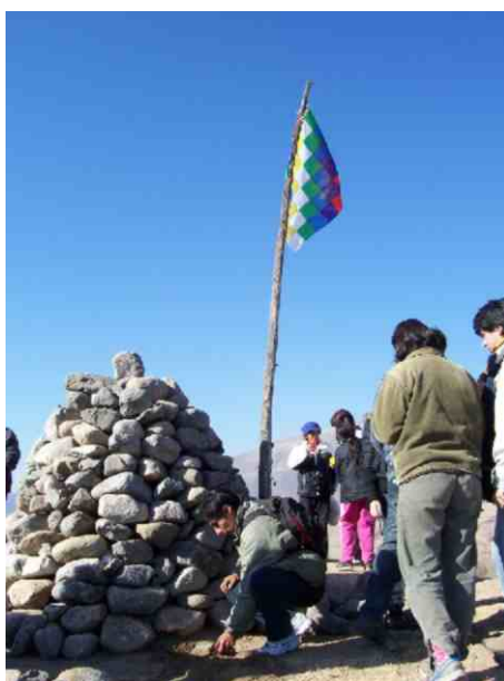
Fig. N° 4 Ceremonia de la pachamama