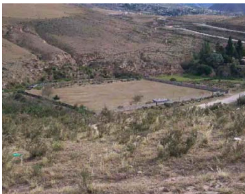
Fig. Nº 6 Vista de la Cancha de fútbol.