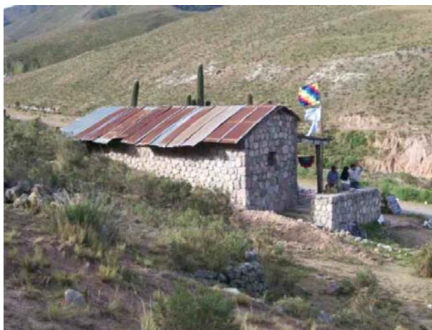
Fig. Nº 3. Casa de piedra en Angostura