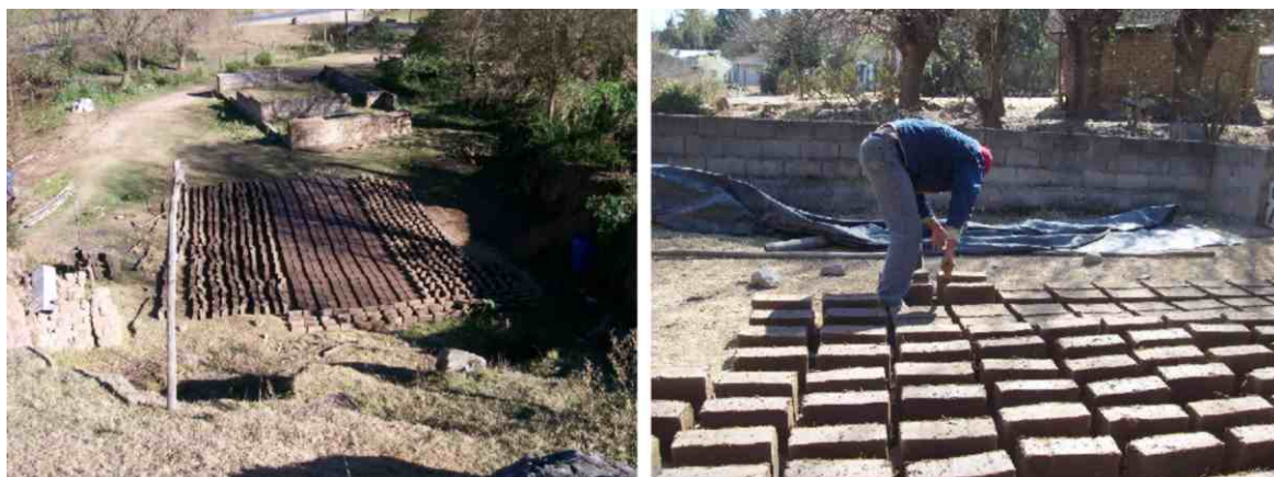
Fig. Nº 9. Producción de adobe