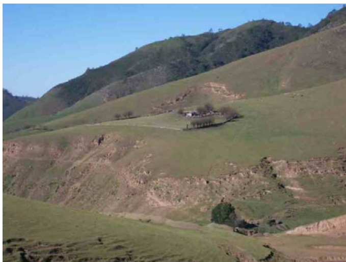
Fig. Nº 10- Vista de los puestos de pastoreo