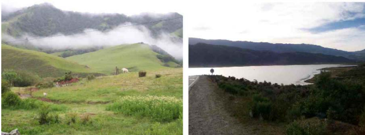
Fig. Nº 2 Vista del valle y vista Dique La Angostura