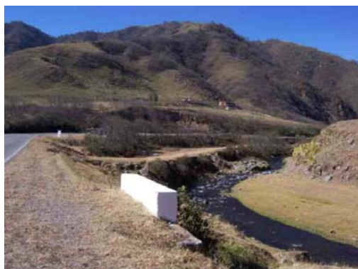
Fig. N° 7 Vista del valle- Zona sur