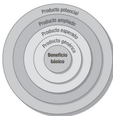
Figura 4: Los 5 niveles de producto

Fuente. Reproducido de Dirección de marketing (14.ª ed., p. 326), por P. Kotler & K. L. Keller, 2012, Pearson Educación. Copyright 2012 por Pearson Educación.