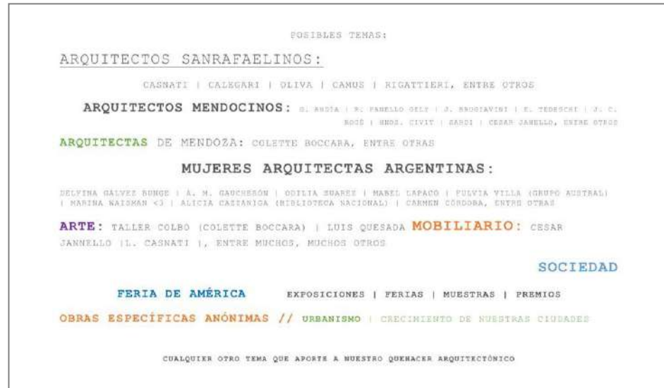
Imagen 2 | Posibles temas a investigar

La primera Unidad de nuestra materia tiene una duración de 3 clases, tres encuentros de 2.5 horas cada uno. La propuesta será explicada en el primero de estos encuentros, comentando los objetivos de esta experiencia, dando la guía para su comprensión y abriendo el dialogo para las inquietudes de los alumnos.