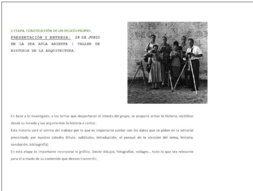
Imagen 3 | Guía

La imagen 3 responde a la guía que se les facilita a los estudiantes para esta segunda experiencia pedagógica. Este segundo módulo de nuestra materia cuenta con una extensión de 6 clases (2.5 horas cada una). En las primeras semanas los jóvenes deberán continuar con sus investigaciones, profundizando los puntos que hemos dialogado en nuestro encuentro de Taller de Historia para darle cierre a su primera etapa de investigación.