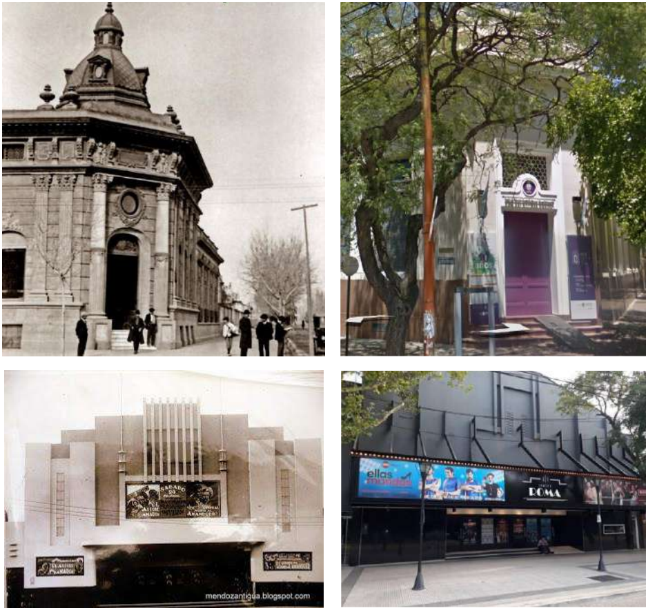
Imagen 4 y 5 | Ex cine Marconi. San Rafael. 1925. Imagen de época y actual

Esto sucede por la falta de conocimiento sobre el tema. Al desconocer la importancia del valor de ciertos edificios es difícil que los ciudadanos se levanten ante una destrucción de alguna obra de interés patrimonial e histórico.