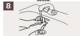
Enjuáguese las manos.