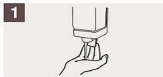
Aplique suficiente jabón para cubrir todas las superficies de las manos.