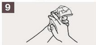
Séqueselas con una toalla de un solo uso.