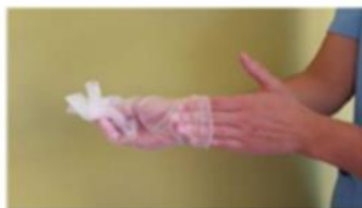
Retirar el segundo guante introduciendo los dedos por el interior