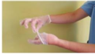
Retirar sin tocar la parte interior del guante