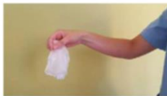
Retirar los dos guantes en el contenedor adecuado