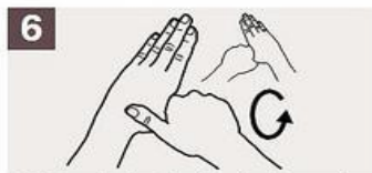
Rodeando el pulgar izquierdo con la palma de la mano derecha, fróteselo con un movimiento de rotación, y viceversa.