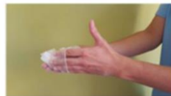
Retirar el guante sin tocar la parte externa del mismo