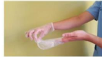
Retirar el guante en su totalidad