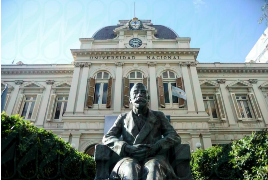
Frente del edificio del Rectorado de la Universidad Nacional de La Plata, avenida 7 / 47 Y 48

La flamante casa de estudios quedó inaugurada públicamente en 18 de abril de 1897 bajo el mandato del Dr. Dardo Rocha, que fuera elegido como su primer Rector, y extendió su vida académica hasta 1905. Comenzó a funcionar con tres facultades - Derecho, Fisicomatemáticas y Química- y una Escuela de Parteras.