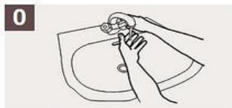
Mójese las manos.

Duración del lavado: entre 40 y 60 segundos