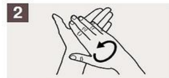
Frótese las palmas de las manos entre sí.