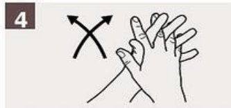
Frótese las palmas de las manos entre sí, con los dedos entrelazados.