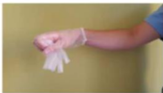
Recoger el primer guante con la otra mano