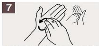
Frótese la punta de los dedos de la mano derecha contra la palma de la mano izquierda, haciendo un movimiento de rotación, y viceversa.