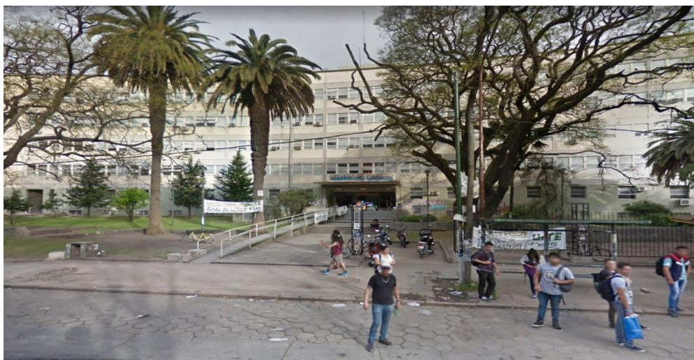
Frente de la FACULTAD DE CIENCIAS MÉDICAS DE LA PLATA. (Avenida 60 y 120)