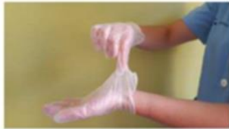
Pellizcar por el exterior del primer guante

Folletería que se les entrega a los alumnos