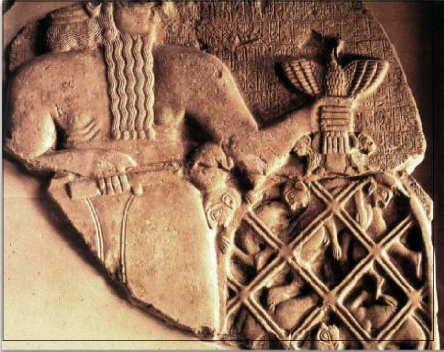
Fig. 2 - Estela de los Buitres, Civilización Sumeria (Detalle). 71