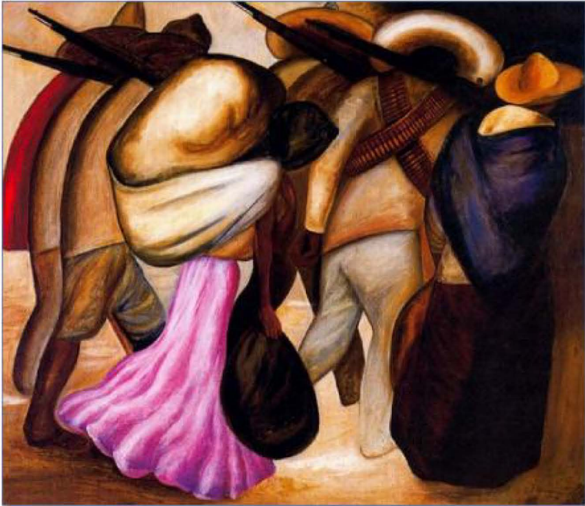
Las Soldaderas , José Clemente Orozco, Colegio San Idefonso, México, 1926 11 .