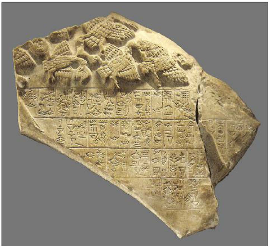
70 Fig. 1- Estela de los Buitres, Civilización Sumeria (Detalle).