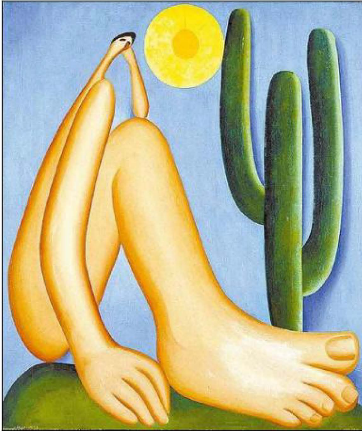
Abaporu, óleo sobre lienzo 1928, símbolo del Grupo Antropofágico 13

perjudicial en la construcción de la identidad cultural y la lucha por la independencia intelectual.