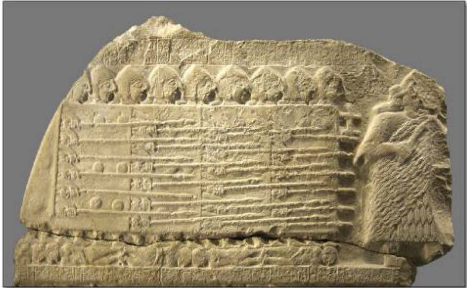
Fig. 3- Estela de los Buitres, Civilización Sumeria (Detalle). 72