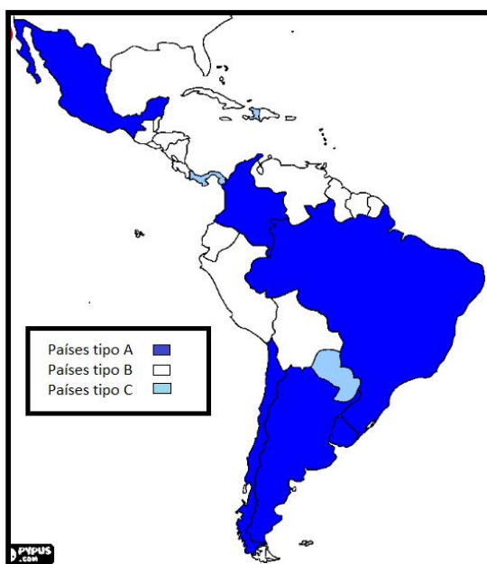
Mapa: Clasificación países dependientes latinoamericanos

Bambirra estudió este proceso histórico centrando su análisis en dos épocas, dos grandes momentos de reorganización del sistema mundial que tuvieron incidencia (por supuesto) en las formas de organización en nuestro continente. Primero, el período de finales del Siglo XIX, época de la segunda revolución industrial y, luego, la depresión de 1930. Su análisis empieza por estos dos momentos y se extiende hasta la etapa de integración monopólica mundial.