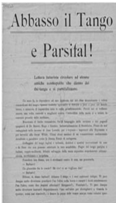
Texto de Abbasso il Tango e Parsifal! de Filippo Tommaso Marinetti. Milán, Dirección del Movimiento Futurista, 1914