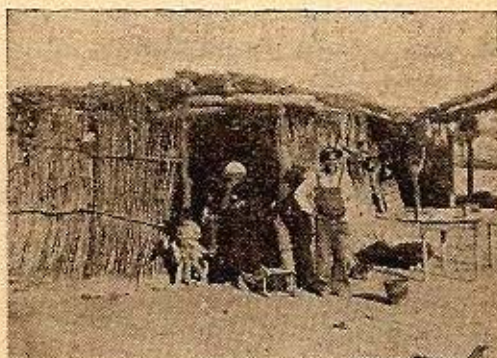
Fig. 2. Rancho de junquillo, con armadura de algarrobo y álamo. Las Hormigas - Guanacache - Lavalle

de sostenerse mayormente en el tiempo. Su vigencia se mide por decenas de años. Y esto se liga a una menor fuerza del vínculo familiar.