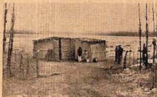
Fig. 7. Rancho de quincha (caña de maíz y barro). Armadura de álamo. Carrizal del Medlo - Luján.