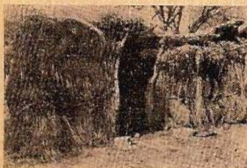
Fig. 6. Vivienda temporaria hecha con Sporobolus rigens . Armadura de algarrobo. Capilla del Rosario - Guanacache - Lavalle.