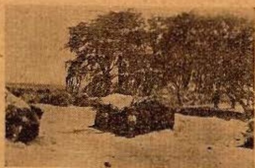
Fig. 4. Vivienda de cortadera y barro. Armadura de sauco. Puesto El Trapal - Dpto. de Malargüe.