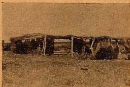
Fig. 3. Rancho abandonado. Paredes de junquillo y chilca. La Balsita - Guanacache - Lavalle.