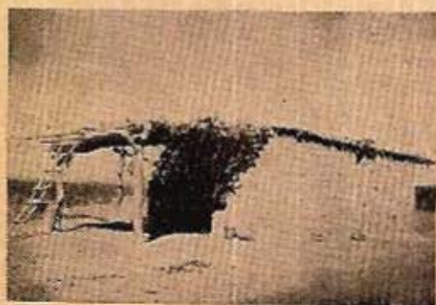
Fig. 8. Vivienda de adobes. Armadura de sauce y álamo. Techo del alero de chilca. Ugarteche - Luján.