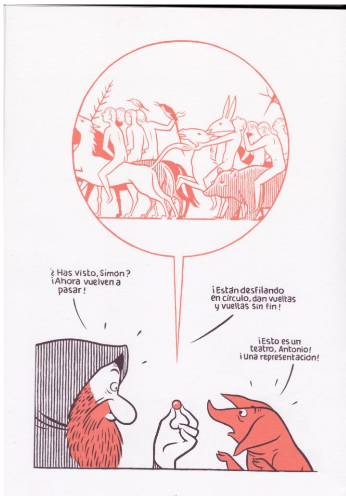
Figura 1: Max, El tríptico de los encantados (una pantomima bosquiana) . Madrid: Museo Nacional del Prado, 2016, p. 60.